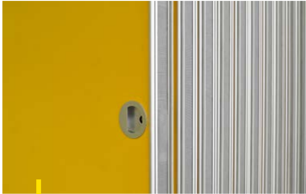
MFC - Stadskanaal, detail van deurkom