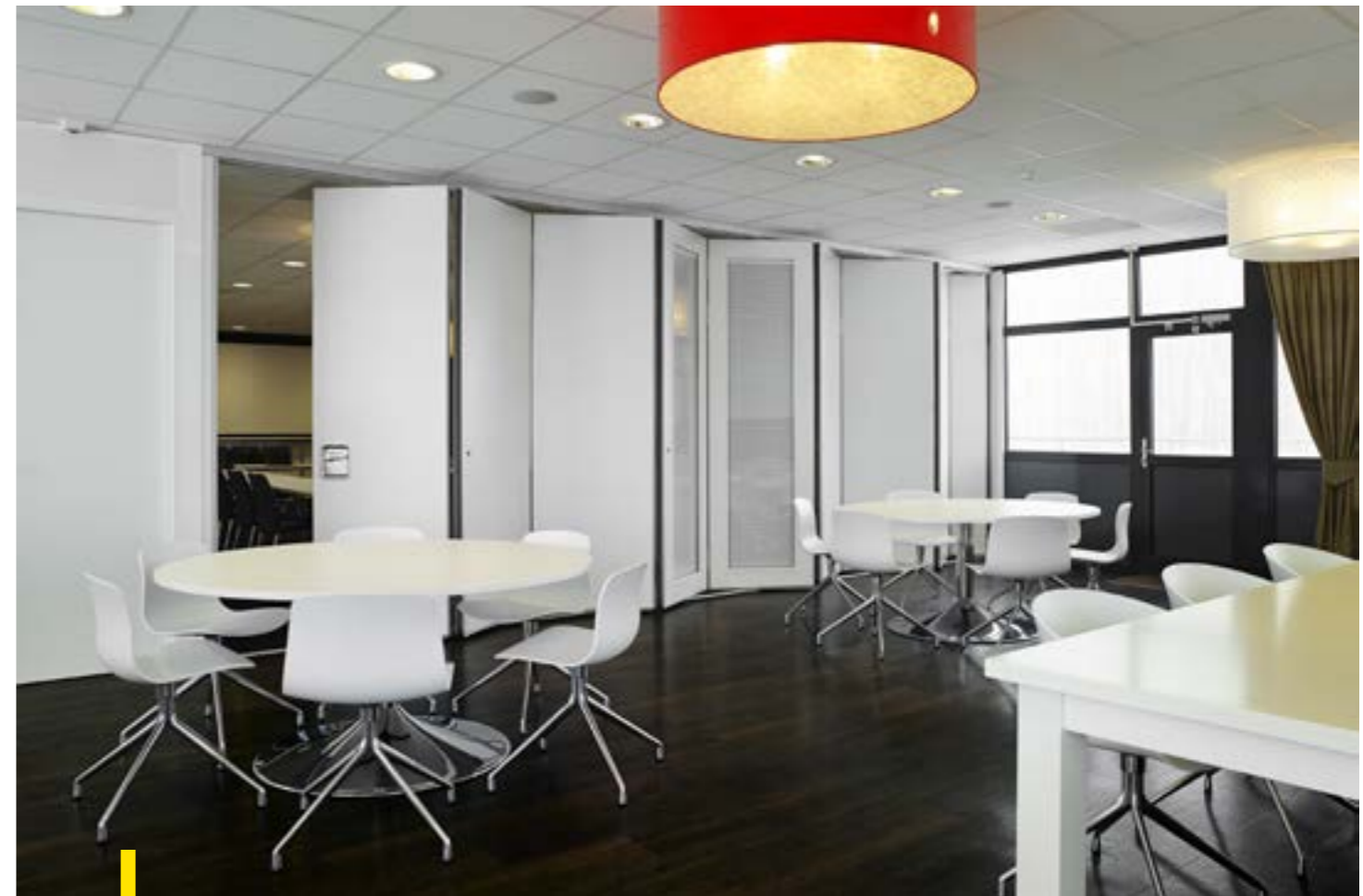
NEC - Hilversum In deze lichte ruimte komt een Visio 100 goed tot zijn recht.