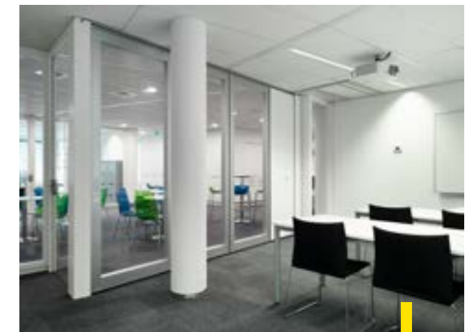
NEC - Hilversum In deze lichte ruimte komt een Visio 100 goed tot zijn recht.