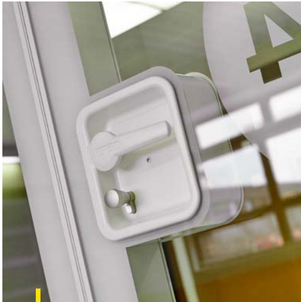
Brede School Houthaven - Amsterdam, detail van de Visio 100