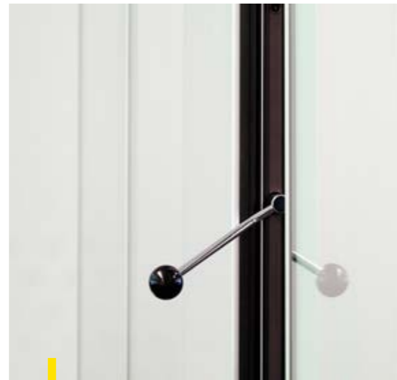
Bediening Visio 100 met het Quick-mechanisme